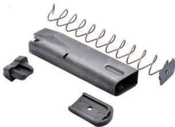
Smontaggio di un serbatoio

provvisto di fori sulla costolatura posteriore per il controllo delle cartucce in esso contenute.