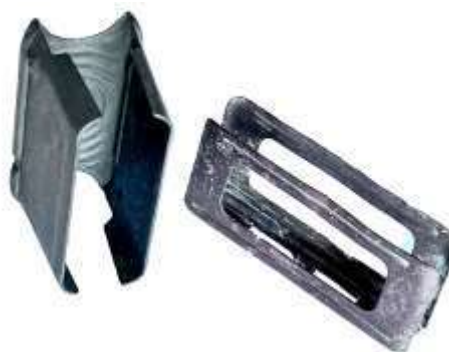
Caricatori a "pacchetto" rispettivamente di un Garand e di un moschetto Carcano mod.91