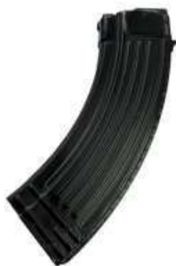
Il caricatore di un fucile automatico

Nella foto un serbatoio "bifilare", dotato dei fori sulla costolatura che consentono il controllo delle cartucce in esso contenute