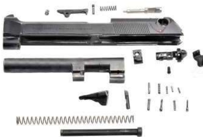
Nella foto lo smontaggio completo di un carrello della pistola Beretta mod. 92/98 FS

indeformabilità agli sforzi dinamici provocati dai colpi durante lo sparo.