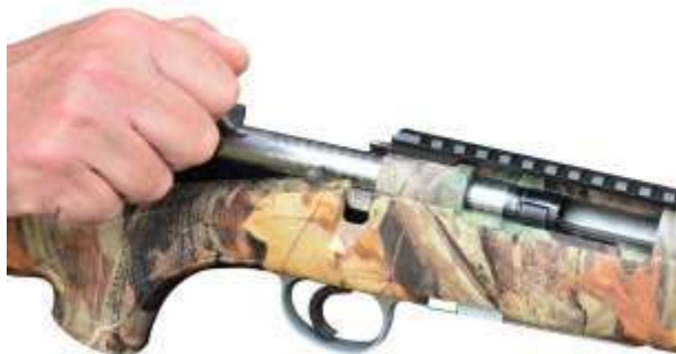
L'otturatore in fase di apertura

È un'arma a ripetizione "ordinaria" ovvero si serve dell'azione del tiratore per il caricamento e sparo in successione delle cartucce. Si avvale di un sistema consistente in un otturatore al cui interno è alloggiato il percussore e l'estrattore. L'otturatore girevole, scorrevole solitamente è provvisto di alette a piani elicoidali che permettono la rotazione dell'otturatore stesso, consentendo la graduale apertura della culatta e l'estrazione graduale del bossolo. L'azionamento dell'otturatore permette di armare il percussore. Per facilitare l'azionamento, l'otturatore è provvisto di un'appendice detta "manubrio". Le carabine possono avere un serbatoio amovibile.