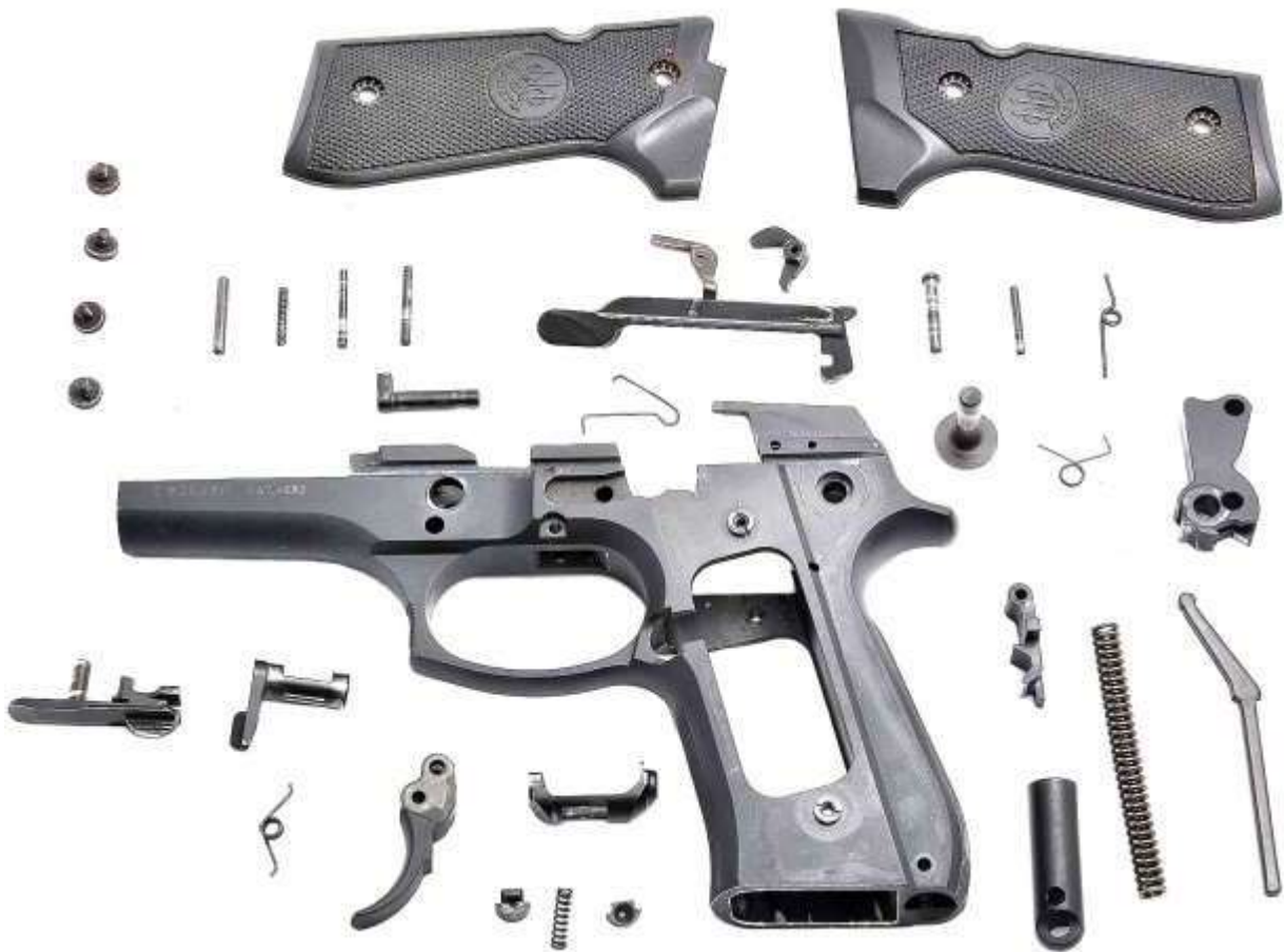
Nella foto lo smontaggio completo del fusto di una pistola Beretta mod. 92/98 FS

In base ai modelli, nel fusto trovano posto la sicura manuale, la leva arresto carrello, anche con funzione di chiavistello di smontaggio, il pulsante sgancio serbatoio, i vari componenti del sistema di scatto, l'espulsore e le guance.