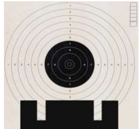
I congegni di mira posizionati “a zona”

Nel tiro sportivo di precisione, si effettua normalmente il tiro cosiddetto “a zona”, ponendo il mirino e la tacca distante dal centro del bersaglio, lasciando una porzione